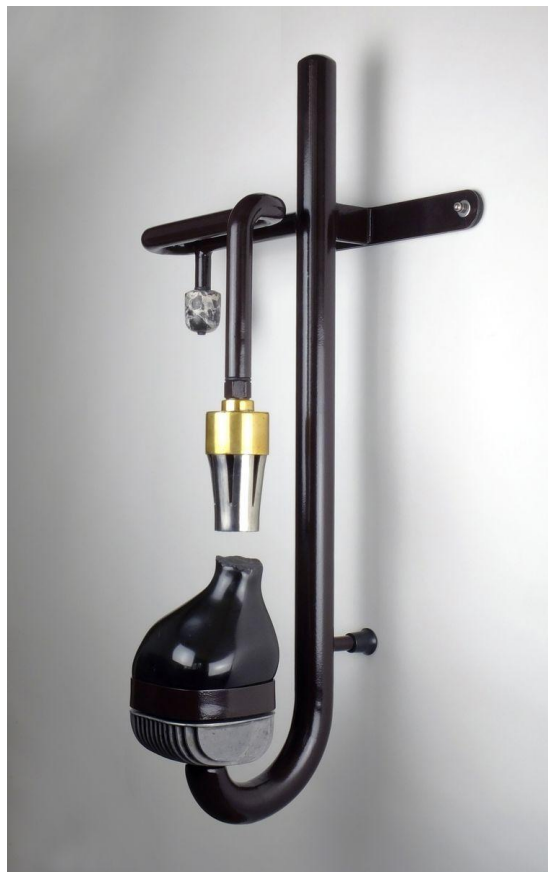
Willem Harbers, van de serie The Last Rock : Scarico .

De tentoongestelde werken vallen uiteen in twee groepen. In een sculptuur als Trabiccò speelt het marmer nog een hoofdrol, zij het een passieve. Een ruwe brok wordt door twee armen op z'n plek gehouden, als de industriële setting voor een pronkstuk.